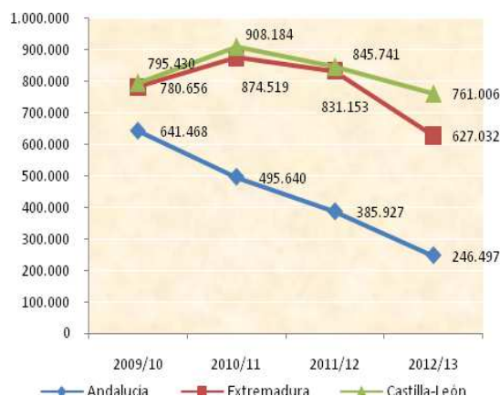
Gráfico 2. Evolución del número total de cerdos por campañas para las tres autonomías que comercializan mayor número de cerdos

Finalmente, el gráfico 3 muestra la evolución, por trimestres, del número anual de cerdos en España.